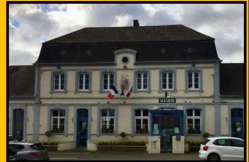
L'Hôtel de ville,