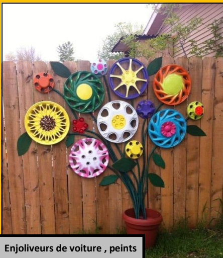
Enjoliveurs de voiture, peints