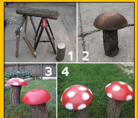
Rondins et assiettes en terre cuite, peintes