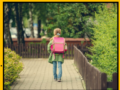
Le trajet pour aller à l'école , ....

...sont des lieux que fréquentent régulièrement vos élèves . Ils font partie de leur environnement quotidien. Il peut être judicieux de négocier avec la Commune, une intégration de travaux d'élèves dans ces espaces: murs, barrières, cloisons amovibles, mobilier, baies vitrées... ce ne sont pas les surfaces qui manqueront !