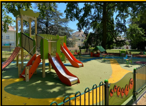
L'aire de jeux, ....