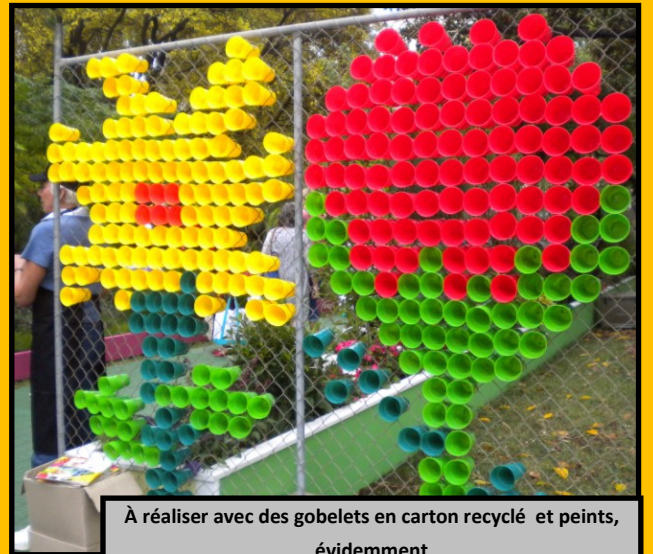
À réaliser avec des gobelets en carton recyclé et peints, évidemment