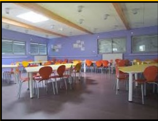
Le restaurant scolaire,